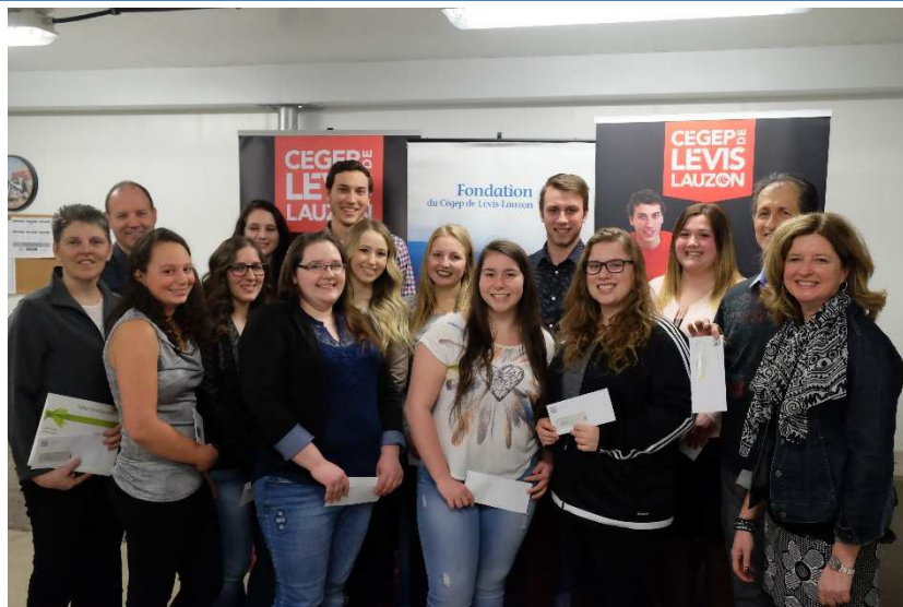
Remise de bourses aux étudiants récipiendaires du programme Gestion et technologies d'entreprise agricole.