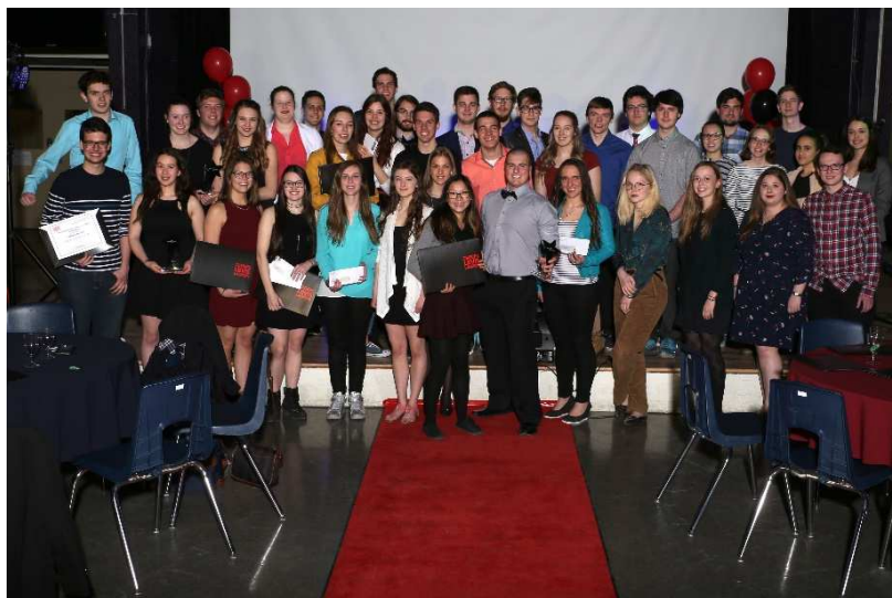
Remise des bourses lors du gala de l'engagement de l'AGEELL

Les étudiants cotisent sur une base volontaire à chacune des sessions, soit 5 $ par étudiant par session. Les sommes recueillies alimentent le Fonds AGEELL et servent à encourager les étudiants au cours de leurs études collégiales sous forme de bourses d'études et par une aide financière aux centres d'aide en mathématiques et en français.